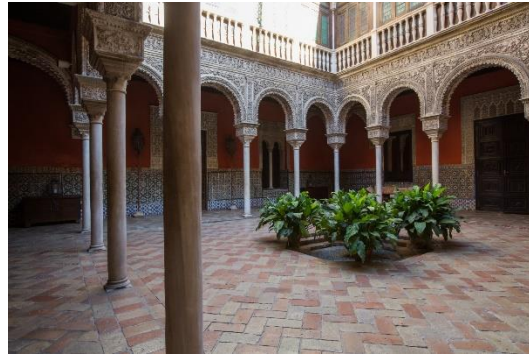
Casa de Salinas

(*): La subida a la Giralda tiene 34 rampas y una escalera final; por lo tanto, se hará de forma voluntaria.