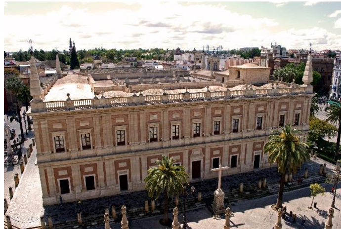
Archivo General de Indias