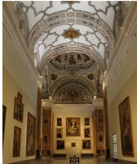
Museo de Bellas Artes